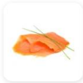
4 tranches de saumon fumé