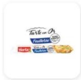
1 rouleau de pâte feuilletée