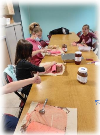
Atelier cuisine : roulé au Nutella