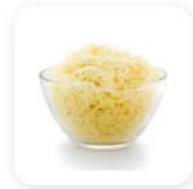
100 g de gruyère râpé