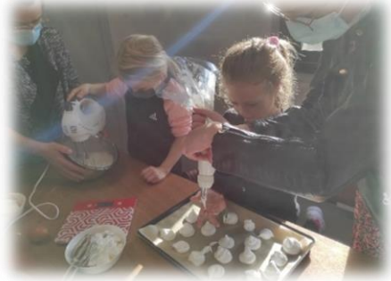
Atelier cuisine : meringue

Les ateliers parentalité ont lieu 2 à 3 fois par mois. Ils sont en très grande majorité gratuits. Ils ont pour but de renforcer les liens entre parents et enfants au travers d'activités proposées par Corentin, Joy, Souane ou des intervenants spécifiques